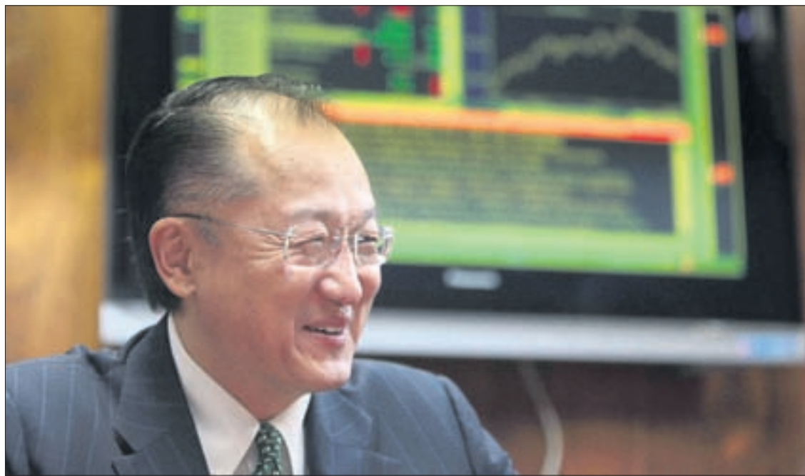
Presidente nobo di Banco Mundial Jim Yong Kim

Contrario na decisionnan anterior pa presidencia di Banco Mundial, e biaha'ki e decision no tabata unanime entre e 25 miembronan di e directorio. Entre e paisnan den desaroyo, Brasil y Sur Africa a apoya Ngozi Okonjo Iweala, mientras cu tres fuente a señala cu China y India a vota pa Kim.